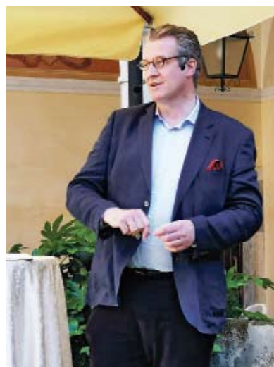
Philipp Blom: Was setzen wir der Primatenpolitik der Populisten entgegen?