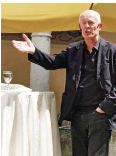
Hans-Joachim Schellnhuber: Unsere Zivilisation steht auf dem Spiel