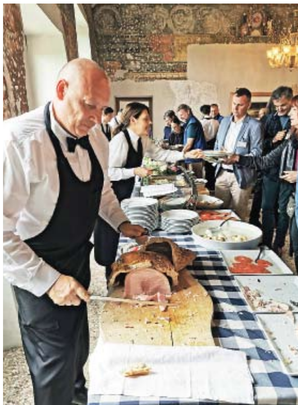
Harald Welzer, das Publikum, die Rosen und eine Pfeife (oben); der Buffetraum auf der Abbazia, mit und ohne Konsumenten. Verzicht braucht hier nicht geleistet zu werden; konsumiert wird Regionales vom Feinsten

braucht zwölf Prozent seiner Fläche für parkende Autos! E-Autos seien „das Methadon der fossilen Kultur“ (Schellnhuber widerspricht umgehend, E-Autos seien sehr wohl sinnvoll). Die autolose Stadt sollte eine analoge Stadt sein, sagt Welzer, das Auto verhindere das, und eine große Koalition aus Regierung und Autoherstellern. Kinder in Warnwesten, man denke!