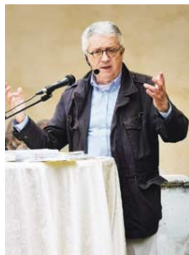
Wolfgang Petritsch: Derzeit keine guten Aussichten für das europäische Modell